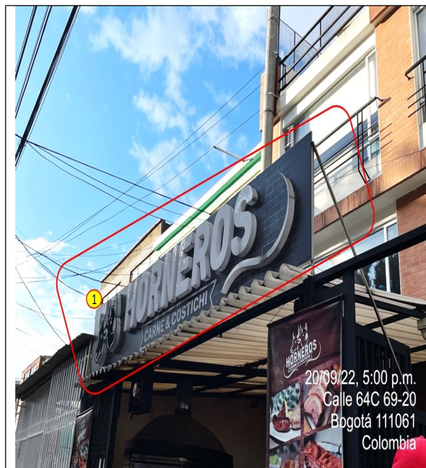
Elemento de PEV, el cual se encuentra volado de la fachada del establecimiento de comercio.