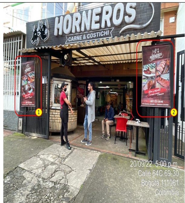
Elementos de PEV del establecimiento comercial, adicionales al aviso único permitido, los cuales se encuentran ubicados en la fachada de la edificación.